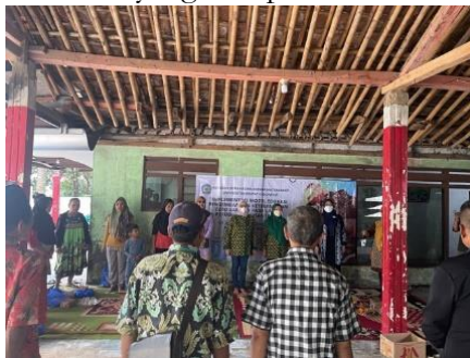
Gambar 2. Persiapan kegiatan pengabdian masyarakat

Metodologi penelitian yang digunakan dalam penelitian ini adalah pendekatan kualitatif. Pendekatan kualitatif merupakan salah satu jenis pendekatan penelitian yang bertujuan untuk memahami fenomena secara mendalam dan holistik dengan cara mengumpulkan data deskriptif yang terdiri dari kata-kata, gambar, atau tindakan. Pendekatan kualitatif digunakan dalam penelitian ini karena tujuan penelitian adalah untuk memahami implementasi model edukasi pengembangan keterampilan zero sampah pada lapak perubahan nusantara, yang memerlukan pemahaman yang mendalam dan terperinci tentang pengalaman, persepsi, dan praktik orang-orang yang terlibat dalam lapak tersebut. Pendekatan kualitatif juga cocok untuk mempelajari masalah-masalah yang kompleks dan sulit diukur secara kuantitatif.