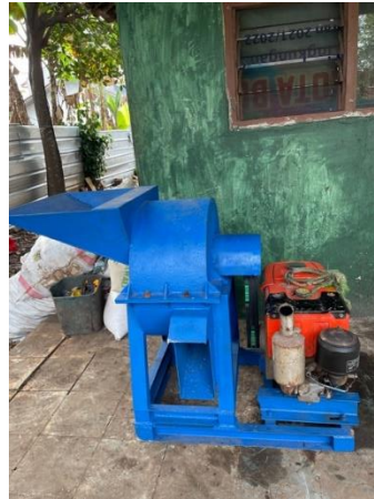
Gambar 3. Alat penghancur sampah